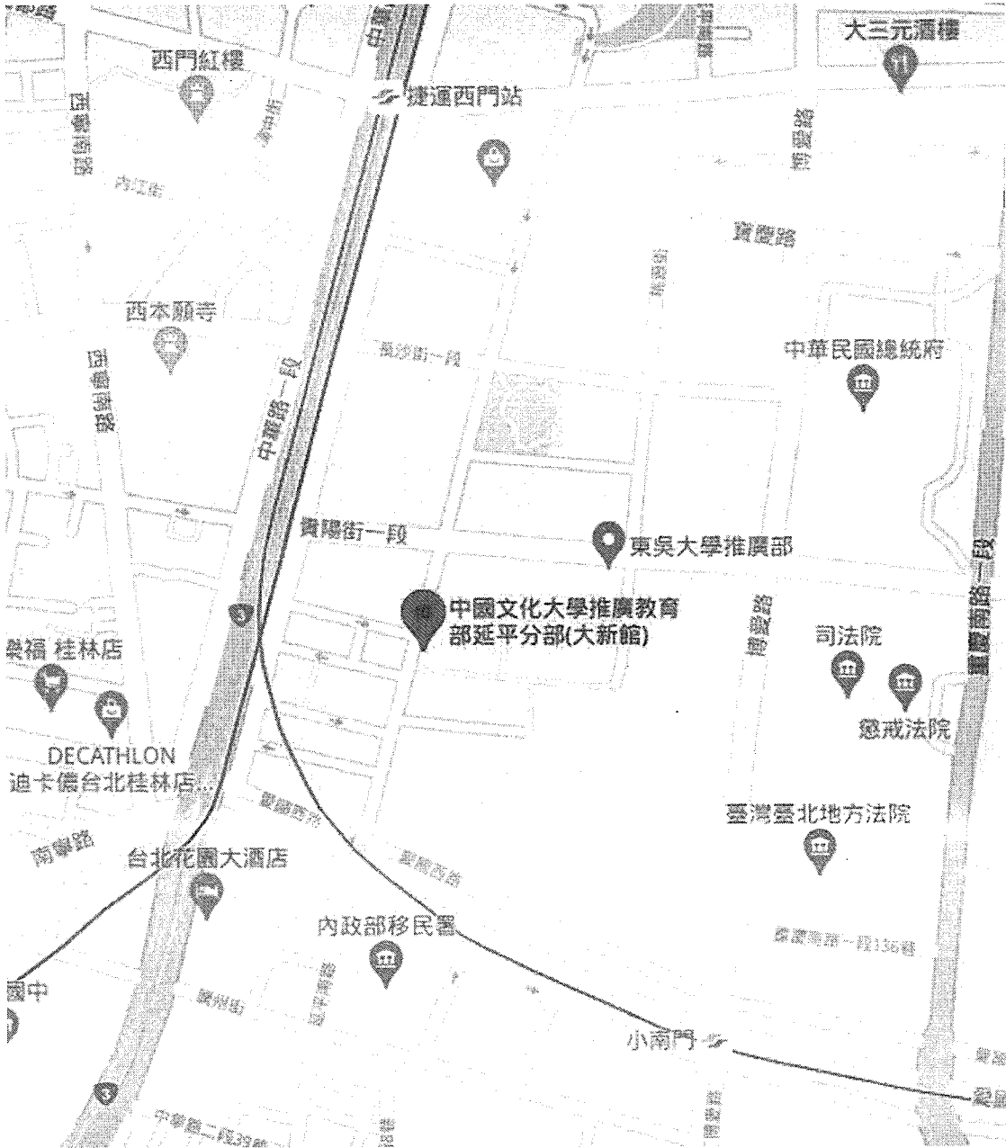
圖 1、中國文化大學大新館位置圖