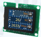
2.8吋 無線 觸控螢幕