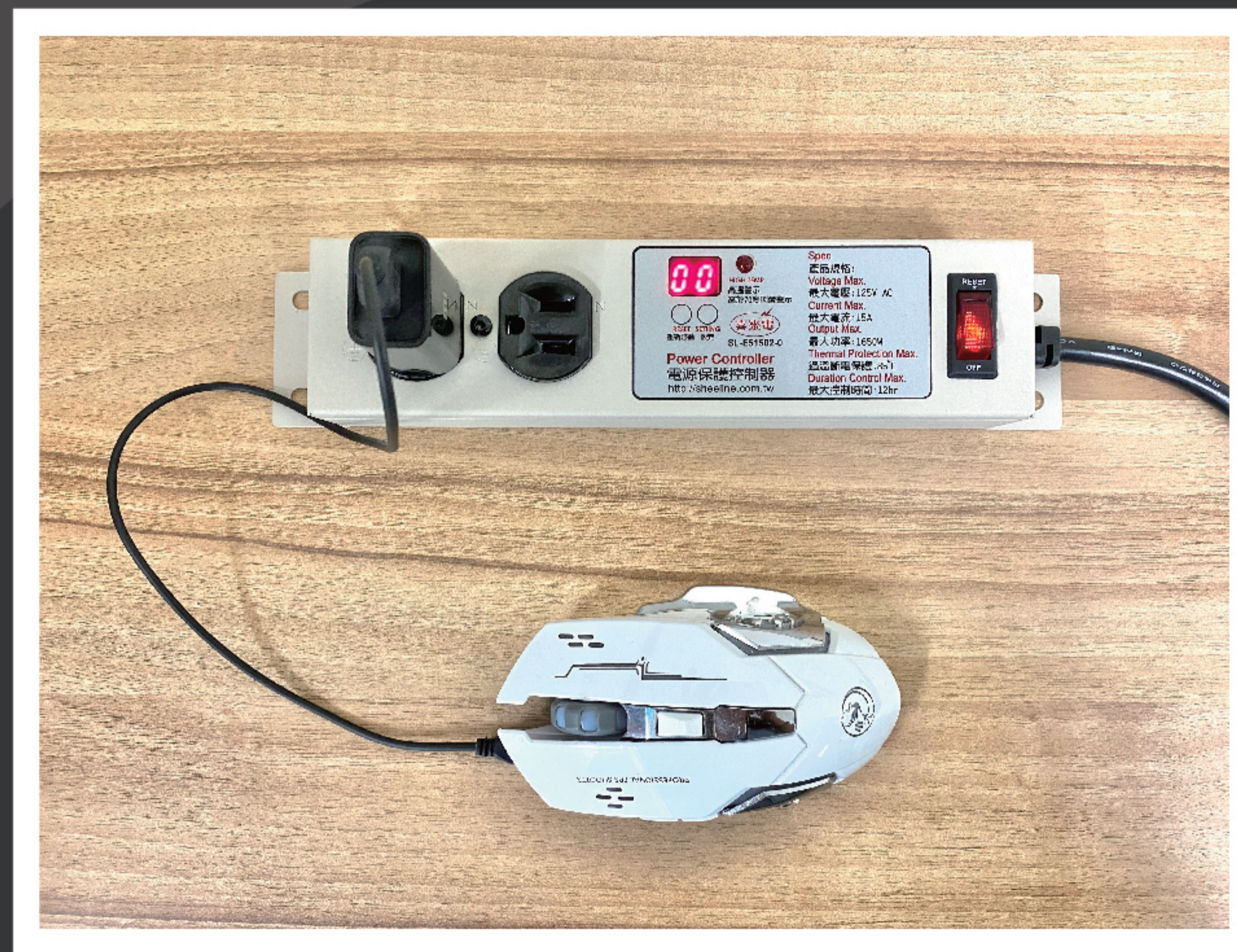
計時結束，自動斷電