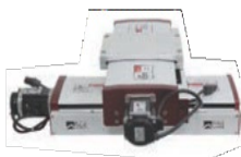
十字平移台 XY Table