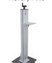
落地式立柱 Fiber Stand