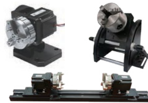
旋轉軸 Rotary Axis