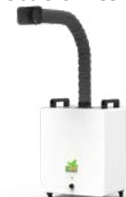
煙塵過濾裝置 Dust Filter