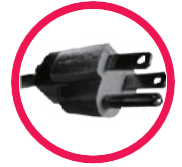
設備電源接頭 Power Plug

Stainless steel, PC, plastic and other metal materials surface marking.