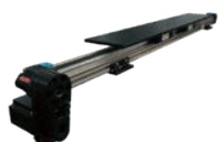
橫向移動軸 X axis Travel Table