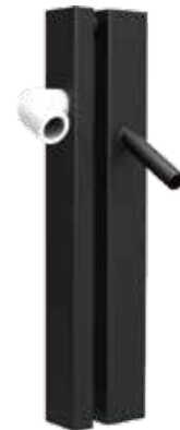
連通管式油水分離機