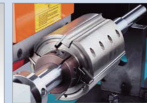
靠板迴轉機構 (磨油壓活動刀頭) 台灣專利: 250751