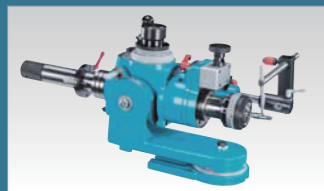
磨螺旋角配件 (手動研磨選配) 台灣專利: 346475