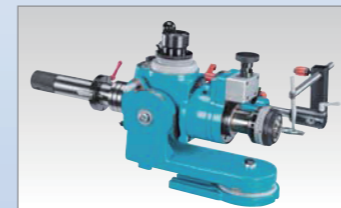
磨螺旋角配件 (手動研磨選配) 台灣專利: 346475