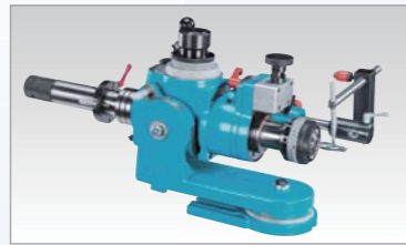
磨螺旋角配件 (手動研磨選配) 台灣專利: 346475